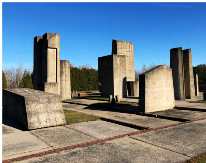
Figure 1 : Monument à la mémoire du Long-Sault.

Le parc de Carillon, le boisé Multi-Ressources Von Allmen, le parc de la halte routière le long de la rivière du Nord et le parc de l'école primaire constituent les espaces verts les plus importants dans la région. Pour relier ces différents parcs, la route qui part de Grenville et Saint-André-d'Argenteuil est considérée par la MRC comme une route panoramique comprenant certains secteurs à fort potentiel historique et patrimonial même si elle n'est pas reconnue officiellement par le fédéral, la province ou la municipalité.