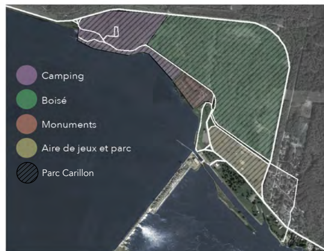
Figure 3 : Lazaris, M. (2020). Les différents usages du parc de Carillon. [Cartographie originale sur fond Google Maps]